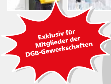
Impressum: Vi.S.d.F. Matthias Knüttel, GUV/FAKULTA, Ruhrstr. 11, 71636 Ludwigsburg; Fotos: Adobe Stock, PantherMedia und Fotolia